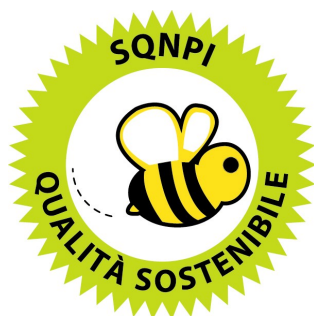
Figura 1: Logo del marchio Produzione Integrata previsto dal Sistema di Qualità Nazionale

SISTEMA DI QUALITÀ NAZIONALE PRODUZIONE INTEGRATA